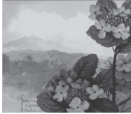
ラゴザ・玉《軽井沢》

「花 -たおやかに咲く-」を開催しています。 桜、ひなげし、紫陽花、椿、梅など四季折々の花たちが自然の中で咲きほこる姿を描いた作品をご紹介します。