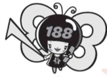
消費者庁 消費者ホットライン188 イメージキャラクター「イヤヤン」

そんなときは一人で悩まずに、全国どこからでも3桁の電話番号でつながる消費者ホットライン「188（いやや!）」にご相談ください。専門の相談員がトラブル解決を支援します。