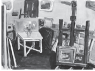
鈴木信太郎〈アトリエ〉

な色合いもお楽しみいただけます。「色彩の画家」鈴木信太郎の豊かな色の世界をご堪能ください。