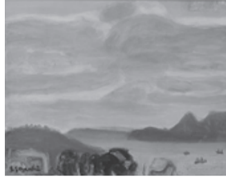
鈴木信太郎《長崎風景》

今回の展覧会では、信太郎はよく旅行をしており、その際に出会った風景や信太郎作品の中でちょっと意外なモチーフを描