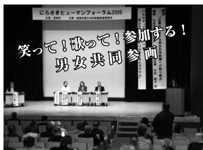
にらさきヒューマンフォーラム2009の様子

男(ひと)と女(ひと)と が性別に関わりなく、その個 性と能力を十分に発揮できる 社会！それが男女共同参画社 会です。 「男ならこうするべき」「女 ならこうするべき」というよ うな男女の役割分担意識を解 消し、地域・社会または家庭 において男女が共に豊かな人 生を築くため、みんなで一緒 に考えてみませんか？ 入場は無料ですので、お気 軽にご参加ください。