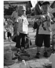
☆夏まつりの様子☆ (葦崎西保育園)