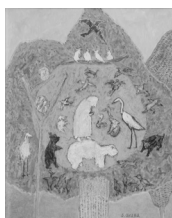
《メルヘン鳥獣戯画(秋)》