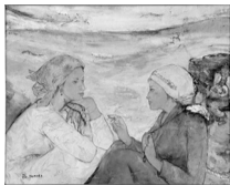
田村能里子《風わたる》