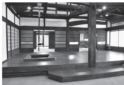
▲主屋内観（3月15日時点）