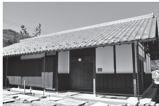
▲主屋外観（3月15日時点）