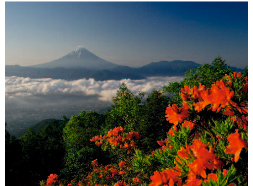
甘利山のレンゲツツジと富士山