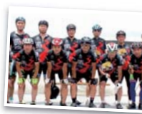
▲昨年の一般販売ジャージ

激坂女子からのご要望「三姫賞にもご褒美を」の声に応え、武田24将同様に三姫特別ジャージ制作決定! 昨年に続いて一般販売向けジャージにもご期待!