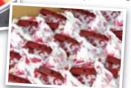
▲山梨定番の銘菓「信玄餅」