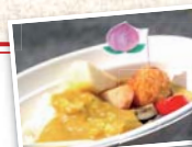
◀戦国ヒルクライムではおなじみの「桃カレー」

今年も会場では山梨名産のフルーツや、地元の食材を使ったお料理、名物・信玄餅などのふるまいを予定しています。ご期待ください!