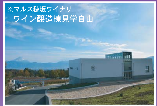
※マルス穂坂ワイナリー ワイン醸造棟見学自由